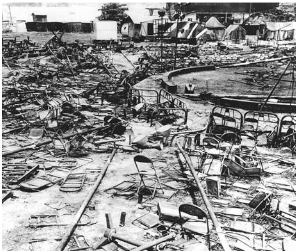
Foto 1 – Picadeiro vazio.

Certamente, a reportagem apropriou-se de informações de testemunhas do local. Mas, ao não mencioná-las, o tom da crônica de olhar pessoal se impõe à descrição jornalisticamente conduzida. Acrescente-se, ainda, que a atenção a detalhes como os sapatos e a mamadeira perdidos no picadeiro destruído, o recurso a imagens como de “tochas vivas” ou de “pessoas se arrastando” e “rasgando roupas aos gritos” para caracterizar o desespero das vítimas, bem como a observação dos carros com fitas para registrar o luto metaforizam os fatos. Desse modo, pode-se dizer que o tom pessoal e a metaforização dos fatos afirmam a empatia como princípio do tratamento dado pela imprensa da época. A empatia caracteriza justamente a vontade de transpor a distância entre os fatos e o observador como princípio analítico, permitindo que o discurso do observador se iguale ao da testemunha do acontecimento. Mas, nesse caso, a empatia serve também para aproximar o leitor e o autor do texto num mesmo plano de identidade, como se um falasse pelo outro. Ocorre, então, uma naturalização da percepção dos fatos a partir da mobilização de elementos e recursos que conferem uma imagem sensível e um significado íntimo ao sucedido, permitindo que leitores dos jornais e revistas fossem transportados para dentro da cena do acontecimento. Com isso, o retrato de dores individuais e localizadas na cidade se afirma como uma dor de todos os leitores e transpõe a experiência particular em experiência coletiva. A