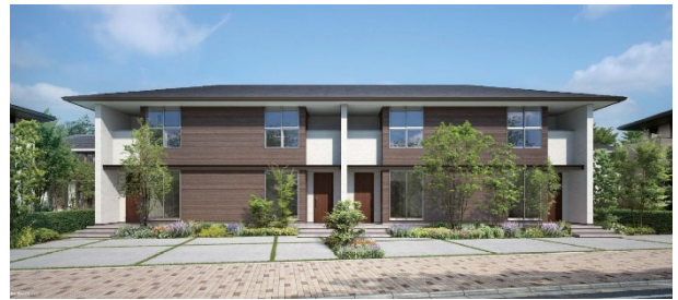
フォレストメゾン 外観イメージ

今回の共同開発は、住友林業の研究施設である筑波研究所での、実棟に即した実験でLL 値 35、LH 値 50(参考資料を参照)を達成。創業以来「木」を軸に事業を展開してきた住友林業の木の知見と木造住宅のノウハウ、熊本城への制振ダンパー納入実績のある住友ゴムの長年のタイヤ材料研究の知見、住宅建材の開発に携わり続けているマックストンのモルタル成形技術を生かし、連携した成果です。