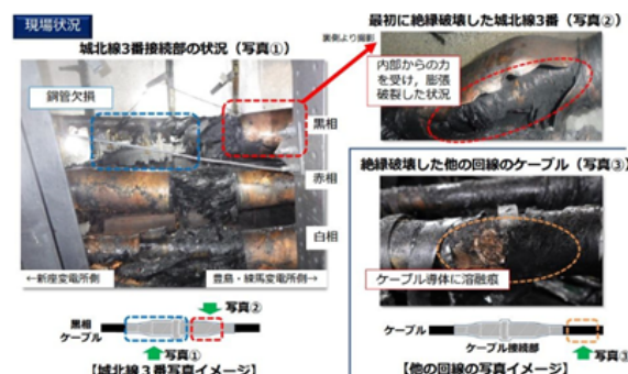
事故原因分析(東電リリース)