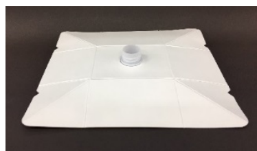
平らに折りたたんだ状態

本製品は平らに折りたたんだ状態で納入し、充填直前にボックス型に組み立てる「組み立て式」を採用。平坦な状態で輸送・保管できるため占有容積を従来の同容量のプラスチックボトルと比較して 80%以上削減できるため、積載効率の向上や保管スペースの大幅な削減が可能です。