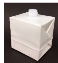
ボックス型(充填前)