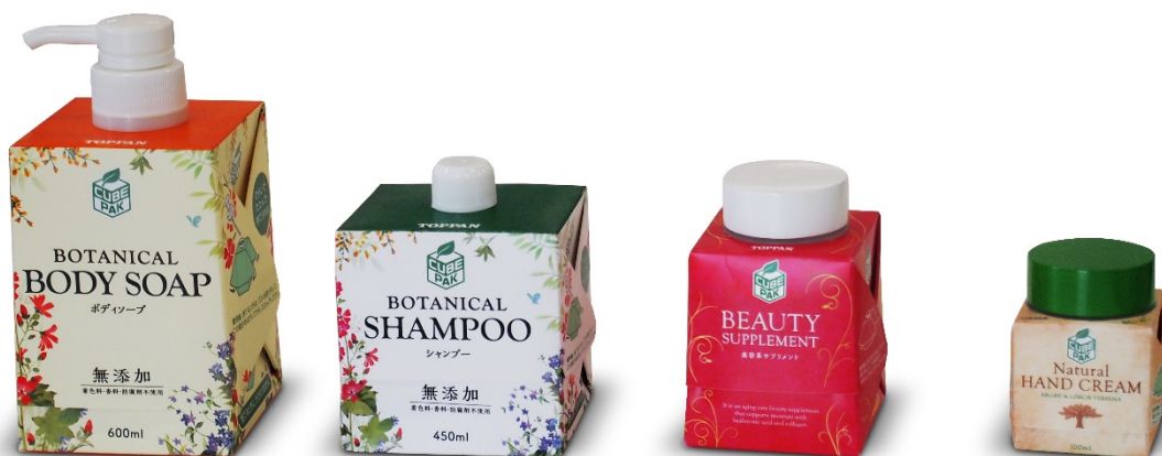
「キューブパック」のサンプル

企業は本製品を採用することにより、プラスチックボトルと比較して、石化由来材料を約75%削減できます。また、既存のプラスチックボトルの充填機を流用しながら、かつ、組み立て式で折りたためる納入形態にすることにより、充填前の輸送や保管費の削減が可能です。